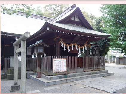
現在の高城神社拜殿

1580年に豊臣秀吉が行田の忍城を攻めた際、高城神社も被害に遭い社殿が壊れてしまいました。しかし由緒ある神社である事から、1671年に忍城当主により社殿が建てられ、戦争も乗り越え、その姿を残しているのです。