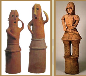
熊谷で発見された「踊る人々」の埴輪(左)とこれまで発見されていたほかの地域の埴輪(右)

みなさんは「埴輪」という物を知っていますか? 埴輪は大昔の人が土をこねて作った人形で、昔の人たちの様子を伝える貴重な物です。87年前、熊谷市の野原古墳群で不思議な形の2体の埴輪が発見されました。