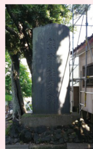
昔、高城神社があった!

高城神社が建てられたのは、奈良時代以前とも言われており、熊谷でも最も歴史の古い神社です。現在熊谷市役所の西にあります。昔、そこより北西に離れた成田用水のほとり、熊野堂の石碑のある場所がありました。