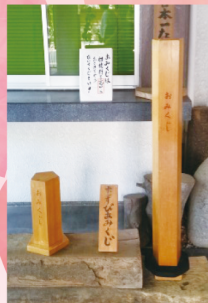
日本一長いおみくじ!

そんな中、最近注目ののは「日本一長いおみくじ」。おみくじの箱が110cm、おみくじの棒が80cmという長さで取り出すのも一苦労ですが、暑い熊谷で、ご利益もアツい?と評判なのです!